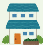
住む予定のない不動産

維持費（修復、管理など）、管理費用が掛かり、固定資産税（税金）を払い続けなくてはならないなど不動産を保持していることで負担になることがあります。